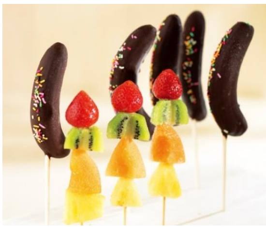
[茶茶]チョコバナナ・カットフルーツ串 3, 780円

これまでお中元を贈ったことがないという方にオススメしたいのが、こちら。儀礼的な贈り物のみならず、気軽な感覚で贈れる、箱を開けたら歓声があがりそうな楽しいギフト。贈る方も贈られる方もワクワク！