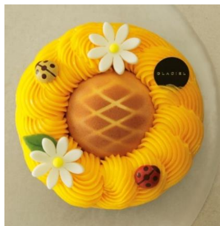
[グラッシェル]マンゴー デテ 5, 184円

ほろ苦いキャラメルアイスの周りをも、花びらに見立てたシャーベットが囲み、中にはマンゴーの果肉入りバニラアイスが。