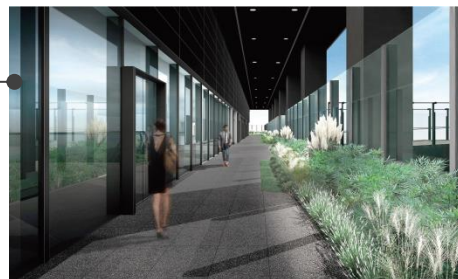
▲新館7F日本橋グリーンテラス(仮称)