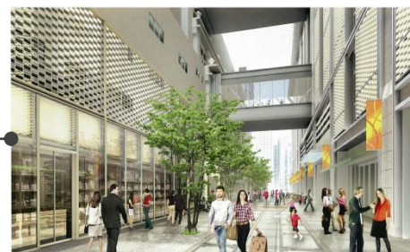
▲日本橋ガレリア(昭和通り方面から)