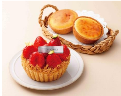
焼きチーズタルト、いちごのタルト

オープニングは泉北高速鉄道と泉中央駅近くにある人気スウィーツショップが登場。シンプルながら、最高の素材を使い、最高の製法でつくすることで、お菓子の生きたおいしさをお届けしています。