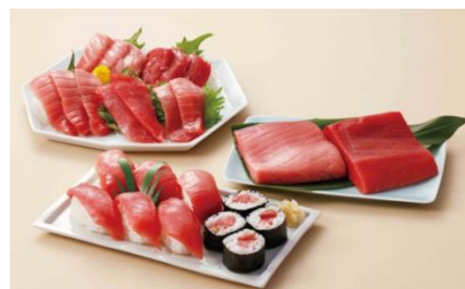
※「マグロづくし」コーナーイメージ

また、少量サイズのお造りやお寿司のほか、海鮮丼など、駅降客のニーズに合わせ、魚屋ならではの商品をご用意いたします。