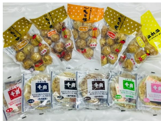
※「おおさかの粉もん」イメージ