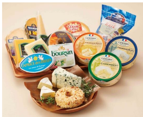
※「チーズ100選」イメージ

「カレー」「チーズ」「缶詰」「おつまみ」をはじめ、こだわりのカテゴリーを100種類以上品揃えした「100選」コーナーが登場、お客様に楽しくお選びいただけるよう、棚いっぱい商品陳列します。また、泉北タカシマヤの味百選から「おおさかの粉もん」を中心に冷凍食品を展開します。