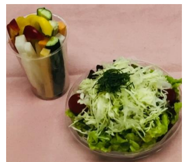
※カット野菜イメージ