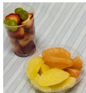
※カットフルーツイメージ

全国展開ならではの広い仕入れ網を生かした豊富な品揃え。忙しい毎日をサポートする「クック 1/2」のカット野菜やカットフルーツをはじめとした半加工商品や「やおいちのおかず」の惣菜を品揃えいたします。