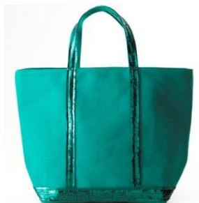
ヴァネッサブリューノ