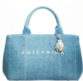
アンテプリマ/ミスト