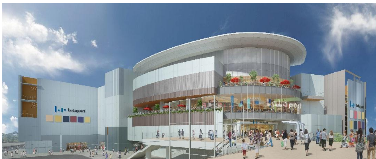
ららぽーと海老名 外観イメージ