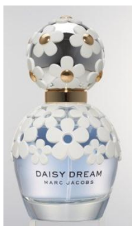
マークジェイコブス