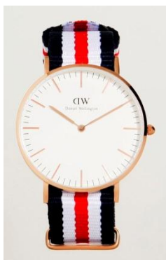
ダニエルウェリントン