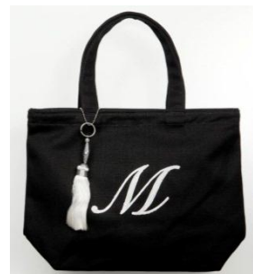
ジュエルナローズ