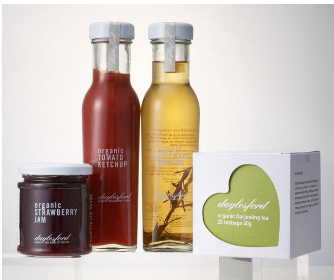
デイルズフォード オーガニック