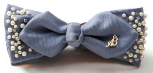
アンジェブルーム