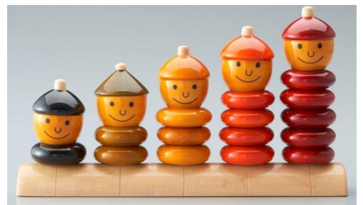
マヤオーガニック