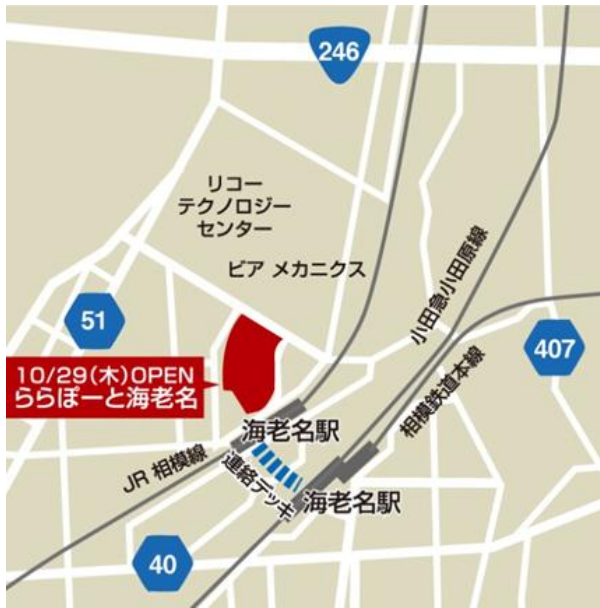
ららぽーと海老名は、JR相模線「海老名」駅直結