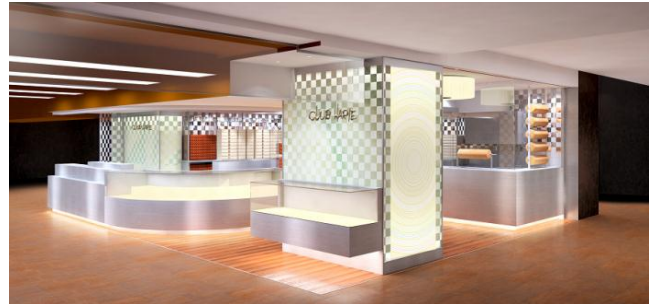
※堀木エリ子氏監修の店舗イメージ