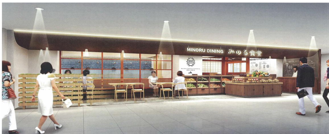
※レストランイメージ

京野菜はもちろん、お肉、お米、お酒など京都府内産をはじめ、各地からの旬のおいしい食材を楽しめる食堂がデビュー。京のおもてなしとして、素材が持つ旨みや風味を引き出す、美味しいお料理をご提供いたします。