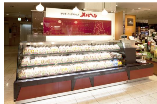
※写真は高島屋新宿店