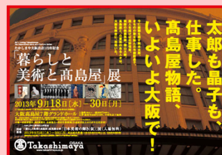
「暮らしと美術と高島屋」展*スター（大阪店）