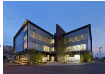
流山おおたかの森S・C ハナミズキテラス