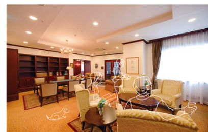
個人住宅リフォームブランド 「ふぁーすと暮らす」