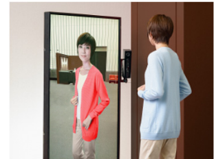
デジタルカラーフィッティング

カシミアコレクションに合わせたデジタルカラーフィッティング、Web試着室を試験導入 新宿店をモデルに、ICT活用したエンターテインメント性の高い販促策を実施