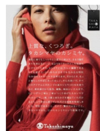
カシミアニット新聞広告

当社オリジナル企画である「カシミアニットコレクション」(10月から全店)は、従来の婦人服、紳士服の拡大に加え、婦人雑貨でも展開、前年から約3倍増となる12億円の売上を計画 展開強化にあたっては、新聞全国紙4ページで訴求、ネットやカタログ通販での購買告知も加え、「オムニチャネル化」を推進、北海道や九州も含めた全国規模での売上拡大を企画