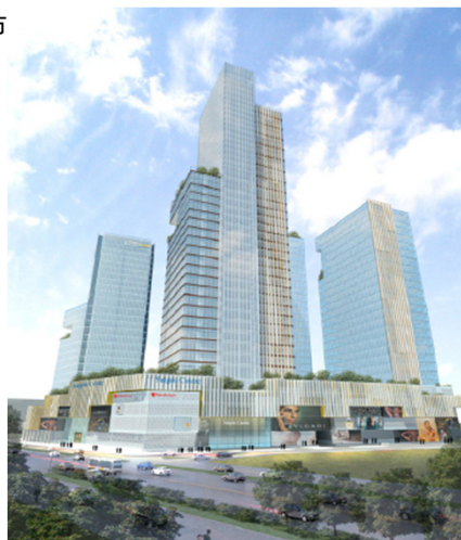
サイゴンセンター全体規模 (単位:㎡)

エリアNO.1の商業集積を目指し、都市の成長に合わせて更なる増床事業計画(3期事業)への参画を検討