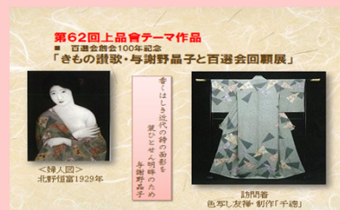
第63回上品會テーマ作品として 百選会の復刻着物物作成