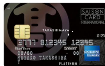
タカシマヤカード VIP

併せて、「タカシマヤカード ゴールド」の入会促進強化を図るとともに、「タカシマヤカード」から「タカシマヤカード ゴールド」へのカード間ランクアップを推進 消費税増税前需要の掘り起こしに向け、時計や宝飾品、インポート商品など、外商顧客対応の高額商材の展開を強化