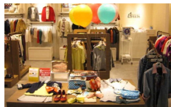
横浜店CSケーススタディキッズ

大阪店では富裕層取り込み強化として新規宝飾品ブランドを導入、特選衣料雑貨ゾーンをさらに拡充 京都店では外商顧客対応強化に向け、メンバーズサロンの改装に続き、宝飾品売場を全面リニューアル 日本橋店ではグランドフロアの活性化に向けて婦人雑貨を再編、上質感のある提案型商材を強化 新宿店では強みとなる婦人服サイズゾーンの拡充や文化催の開催を積極化 横浜店では子供服「CSケーススタディキッズ」に加え、食料品における「銘菓百選」(13年下期中)、「味百選」(14年予定)等、自主編集売場を拡充